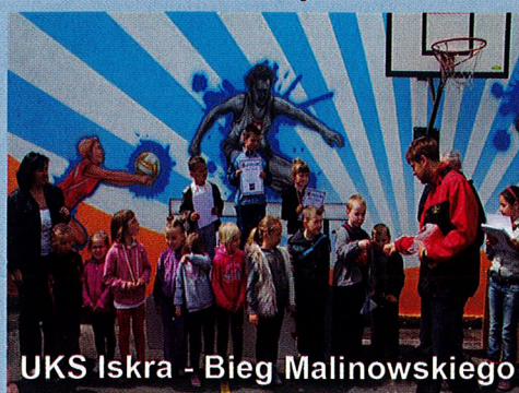
UKS Iskra - Bieg Malinowskiego

Na terenach wiejskich kulturę sportową krzewią Ludowe Kluby Sportowe: Błyskawica Pakosław, Sparta Brody, Stowarzyszenie Piłkarskie Grom Zębowo, TG Sokół Brody, UKS Iskra Chmielinko, UKS Promień Zębowo.