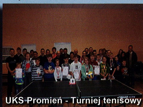
UKS-Promień - Turniej teniśowy