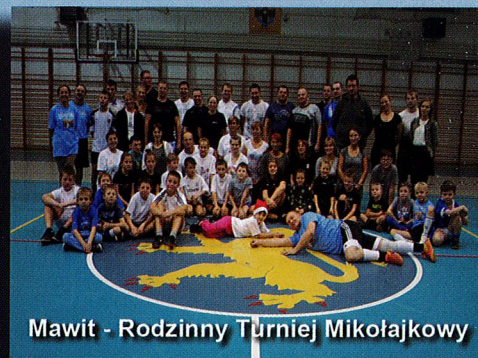
Mawit - Rodzinny Turniej Mikołajkowy